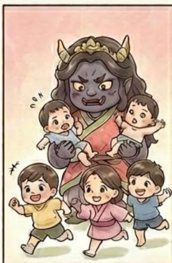
他人の子を奪う鬼子母神